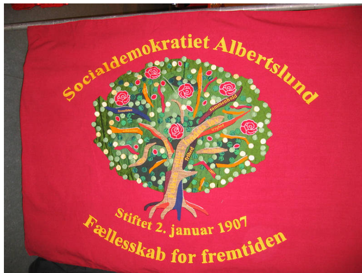
Her er et billede af den nye fane.